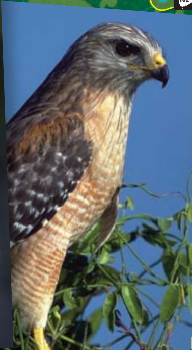
l'épervier de Cooper