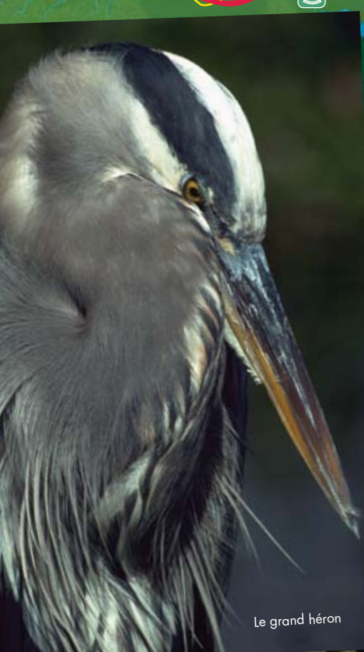
Le grand héron

La diversité de ses espèces d'oiseaux fait la réputation de Grand Lake Meadows. Plus de 260 sortes d'oiseaux vivent dans cette région, y compris 40 espèces dont la survie dépend des richesses des milieux humides.